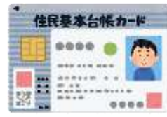
住民基本台帳カード