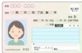
マイナンバーカード