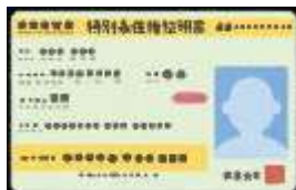
特別永住権証明書