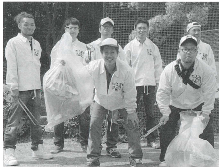
“絆” 感謝清掃運動風景