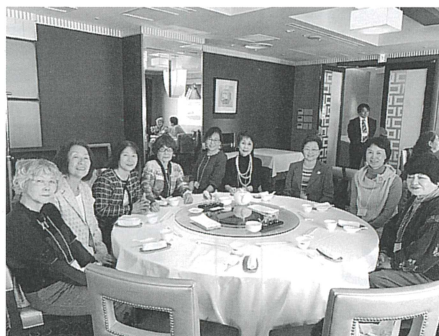
女性部全国大会に参加