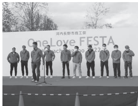
One Love FESTA