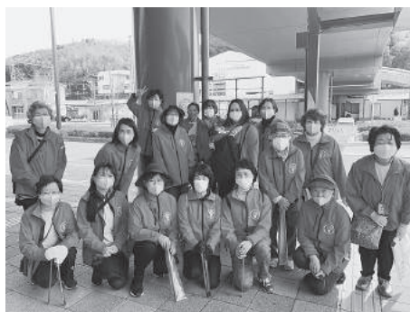
河内長野市内清掃活動