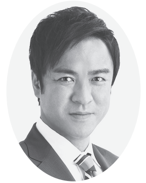
河内長野市長 西野 修平