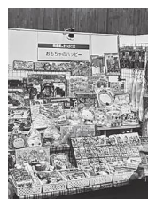
おもちゃのハッピー