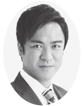
河内長野市長 西野 修平