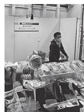
ギフト・ミヤユキ